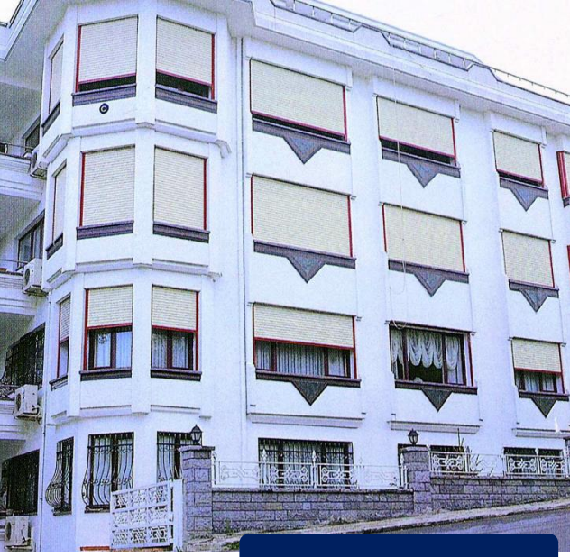
POLİRETANLI PENCERE PALETLERİ