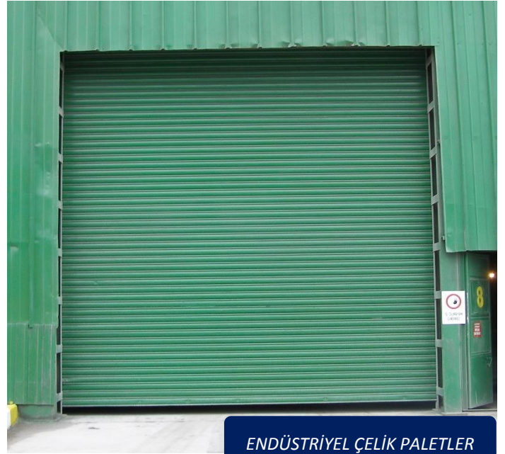
ENDÜSTRİYEL ÇELİK PALETLER