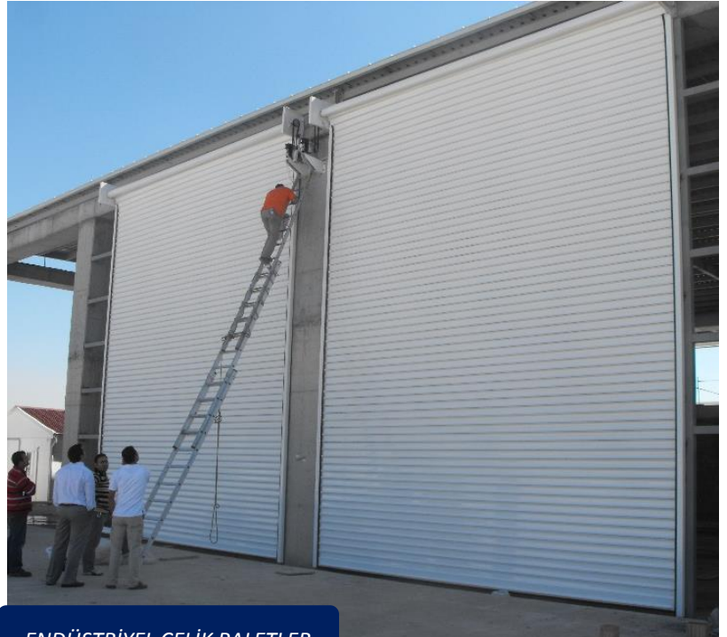
ENDÜSTRİYEL ÇELİK PALETLER