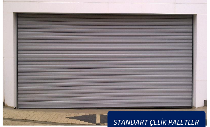
STANDART ÇELİK PALETLER